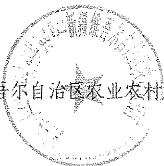
新疆维吾尔自治区农业农村厅