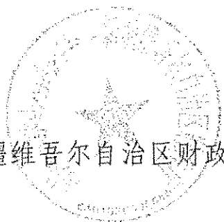
新疆维吾尔自治区财政厅