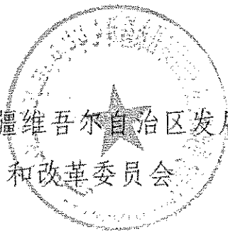
新疆维吾尔自治区发展 和改革委员会