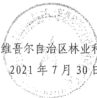
新疆维吾尔自治区林业和草原局