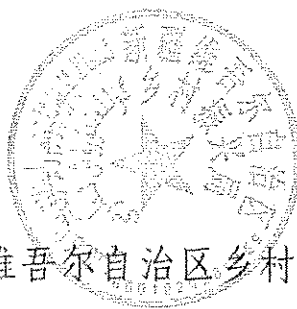
新疆维吾尔自治区乡村振兴局