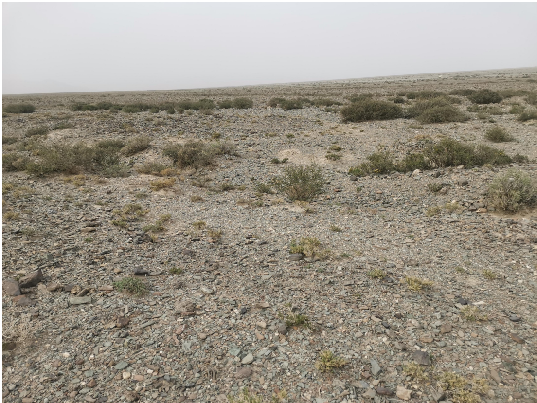
照片 1-1 矿区地形地貌