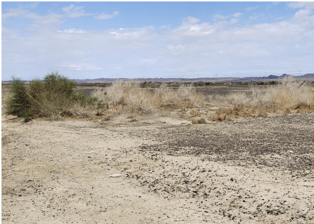
照片 1-2 矿区土壤植被