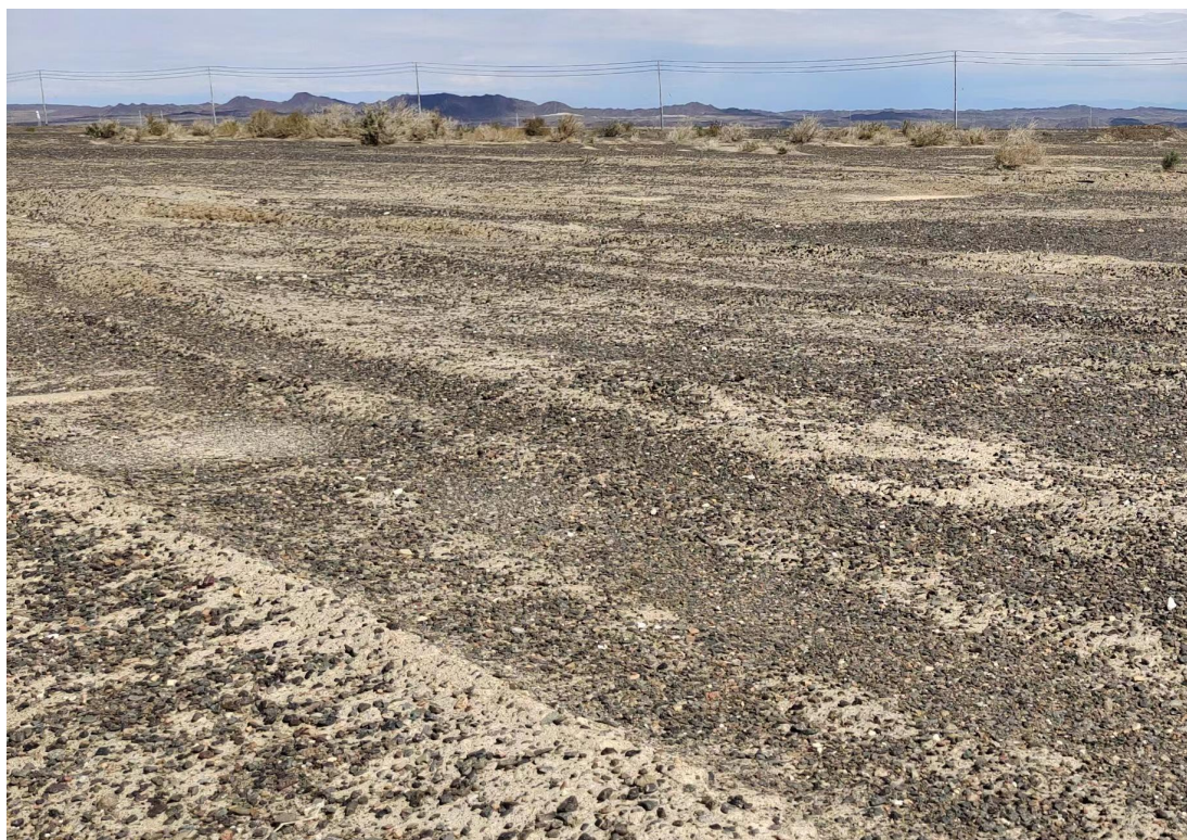
照片 3-1 矿区现状

矿区海拔标高 1938.0 米~1920.0 米，最大高差 18.0 米。矿区地势较平坦开阔，为平原地形。现状条件下矿山未进行采掘活动，现状条件下评估区内未发生崩塌地质灾害（见照片 3-1）。